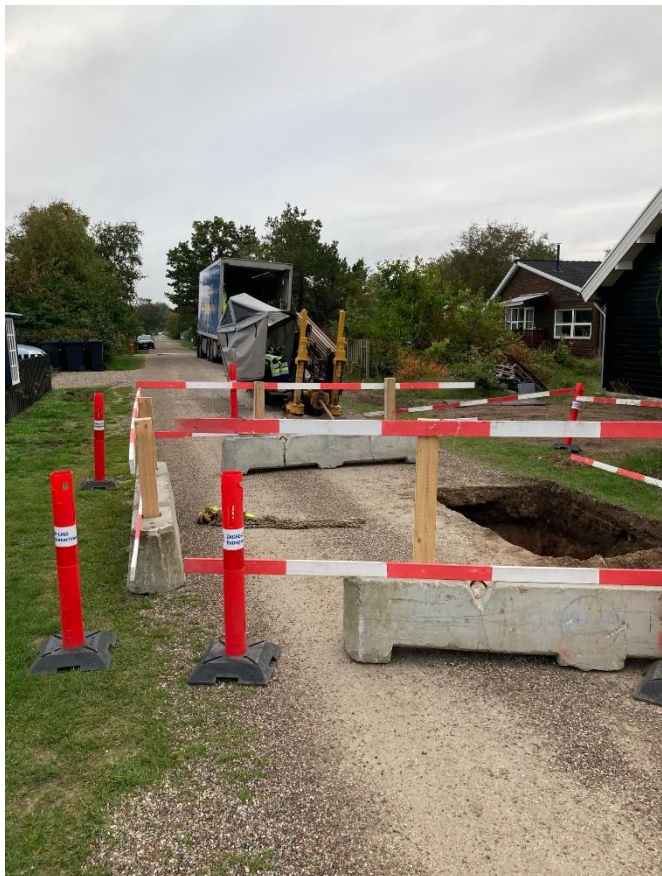
Styret underboring – udført tidligere på Storkevej

På Storkevej og Tranevej vil vi i de kommende ca. 3 uger foretage styret underboring af trykledninger. Selve boringen pr. sted tager 1 dags tid, så I vil opleve at boreudstyret ligger og flytter lidt rundt på jeres veje.