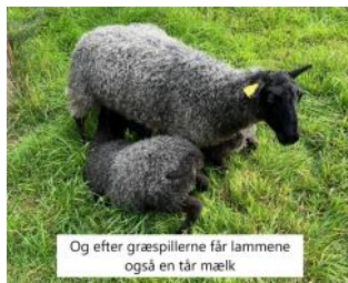
Og efter græspillerne får lammene også en tår mælk

Morfåret får stadig græspiller som tilskud for at sikre, at hun har mælk nok til at lammene kan die. De 3 andre får også lidt græspiller, for de er allesammen ellevilde med dem og skubber for at komme til fadet, så det job er lettest hvis alle 4 får nogle.